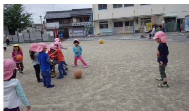
↑転がしドッジ、がんばるぞ！ 当たらないように気を付けるぞ！