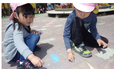
↑チョークを使って地面にお絵かき中。